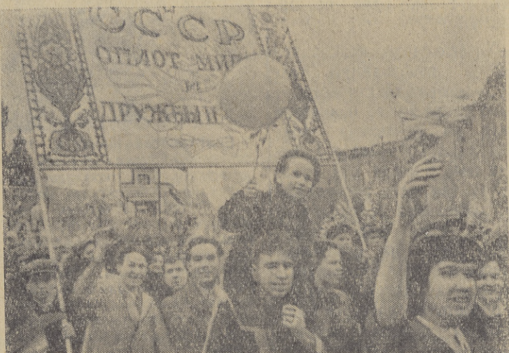
Празднование Первого мая 1958 года в Москве. Демонстрация представителей трудящихся.

и за получение молока на сто гектаров сельскохозяйственных угодий в колхозах и совхозах 134 центнера и на одну фуражную корову в колхозах—2.257 килограммов и в совхозах —по 3.027 килограммов утвердить ВЛАДИМИРСКУЮ ОБЛАСТЬ участником Всесоюзной сельскохозяйственной выставки 1958 года и наградить Дипломом II степени.