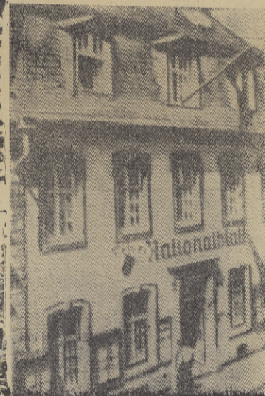
Дом в Трире, в котором родился Карл Маркс.

К. Маркс разъяснил, что вместе с развитием крупного капиталистического производства усиливается и мощь объединенного труда. Пролетарии осознают противоположность своих интересов интересам буржуазии, сплачиваются и поднимаются на героическую борьбу за свержение господства капитала. В.И. Ленин указывал, что «Главное в учении Маркса, это выяснение всемирно-исторической роли пролетариата, как создателя социалистического общества» (Соч.,