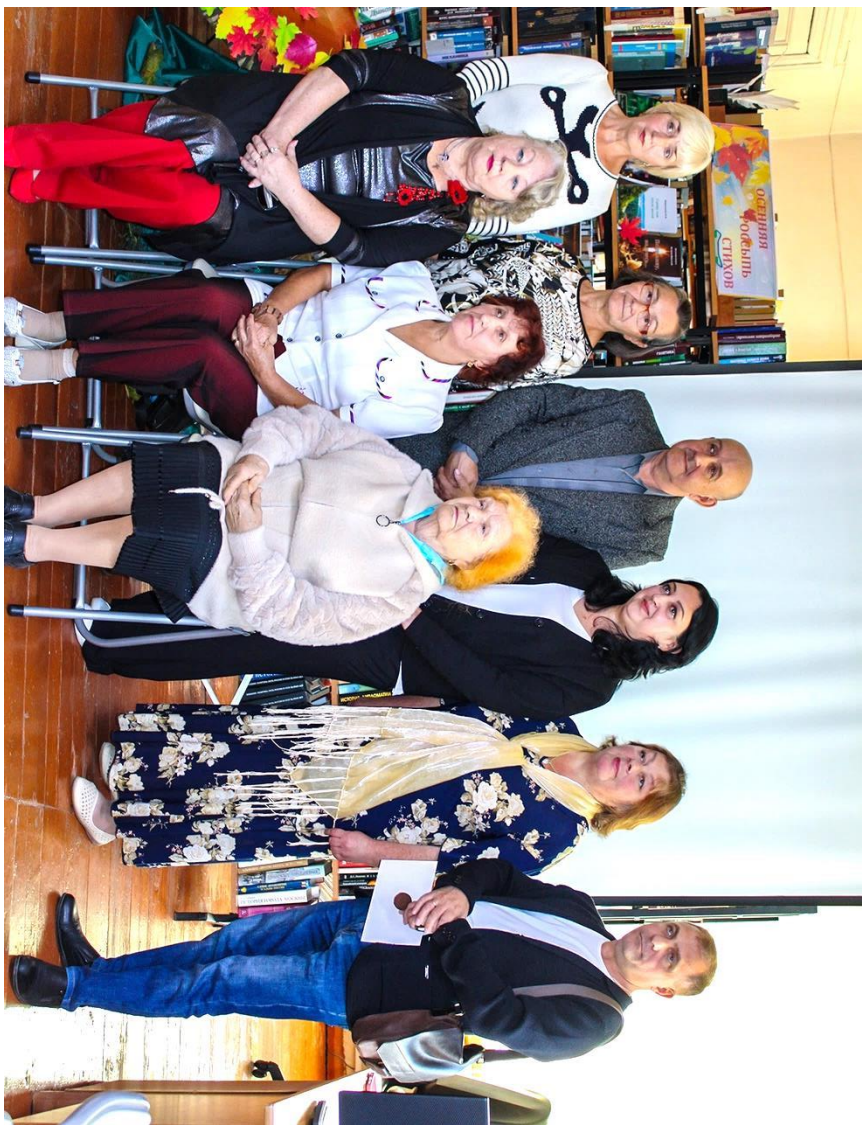
ФОТО с фестиваля 2024 год